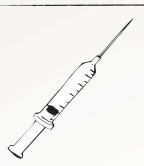
Sharing of contaminated needles