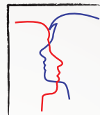
Unprotected sexual intercourse